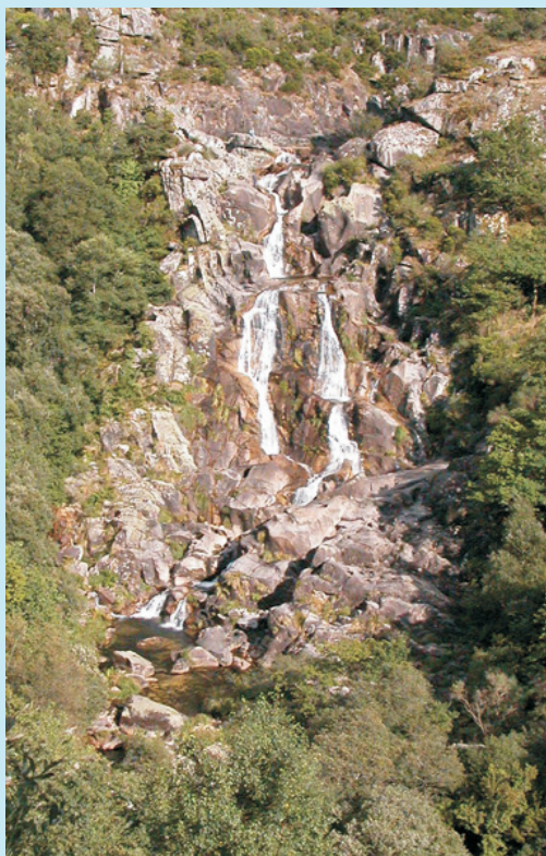
A ferveza no verán

Desde A Lama pola estrada de Gaxate e de alí a Paradela e Liñares. Desde Pontecaldelas vaise a Xende e de alí a Liñares. Desde alí por un sendeiro a pé ata a ferveza nuns 30 minutos. Tamén se pode ir desde Paradela seguindo as levadas da auga dos muíños.