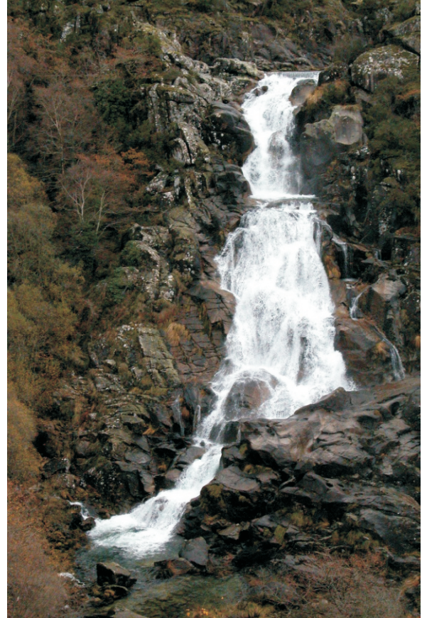
A ferveza no inverno